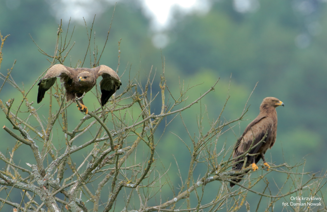
Orlik krzykliwy