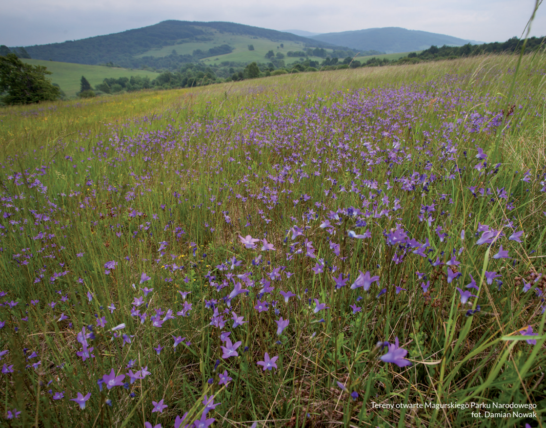
Tereny otwarte Magurskiego Parku Narodowego