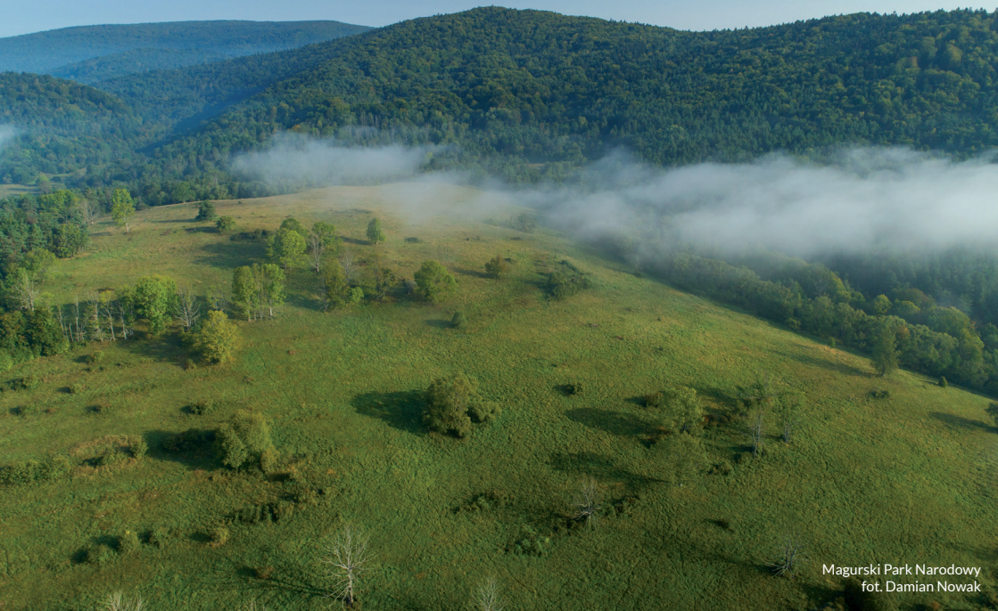
Magurski Park Narodowy