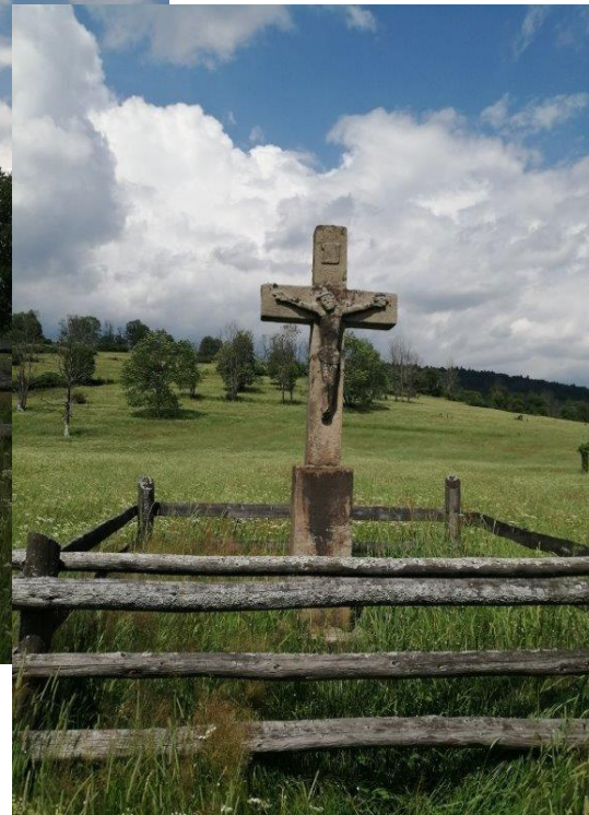
Krzyże i kapliczki z doliny Nieznajowej