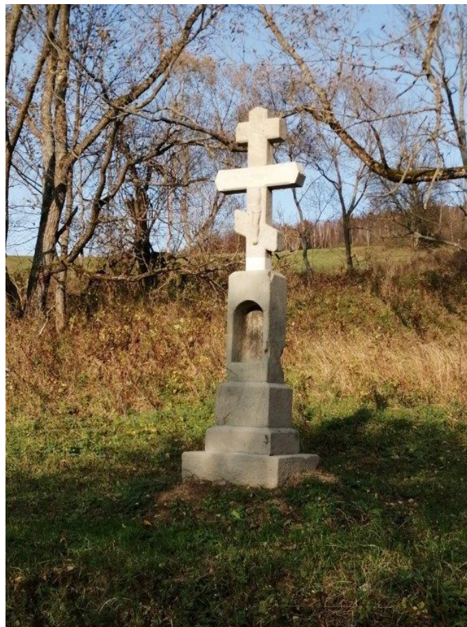
Wyremontowane krzyże z Żydowskiego