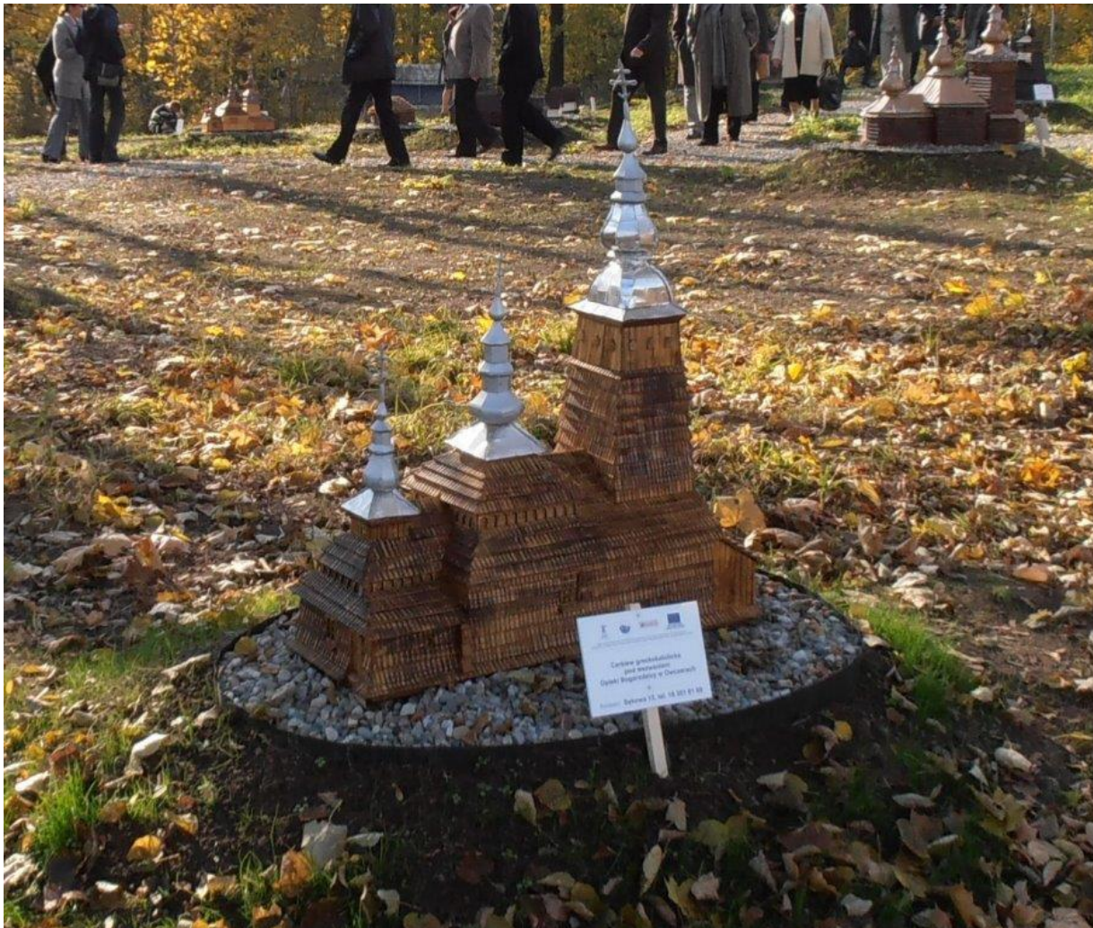
Park Miniatur w Ropie