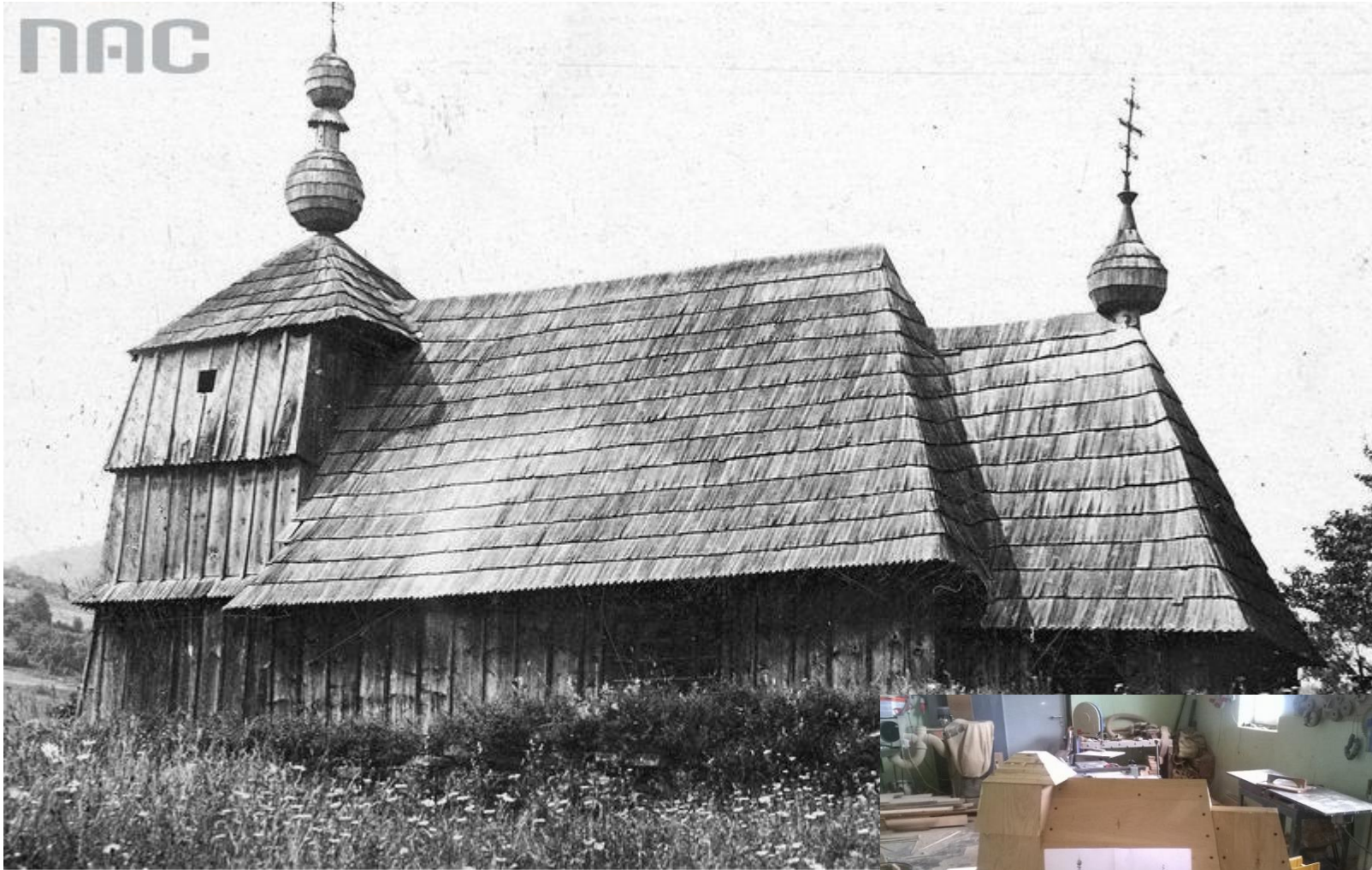
sygn. 1-U-8312